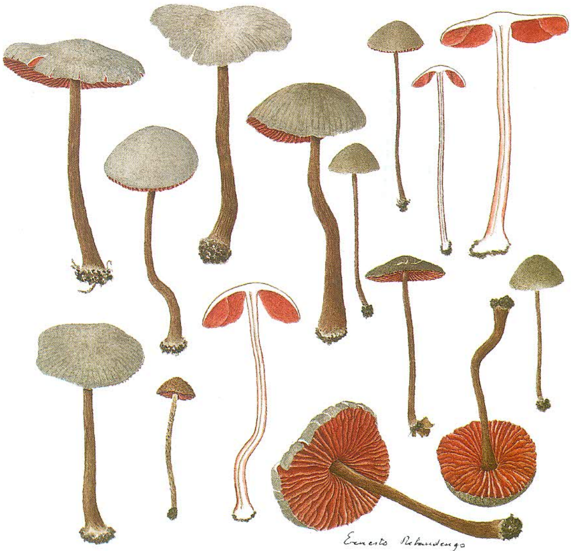
Melanophyllum haemospermum (Bull.) Kreisel

In caso di mancato recapito restituire al C.R.P. CUNEO - C.P.O. per la restituzione al mittente che si impegna a pagare la relativa tariffa